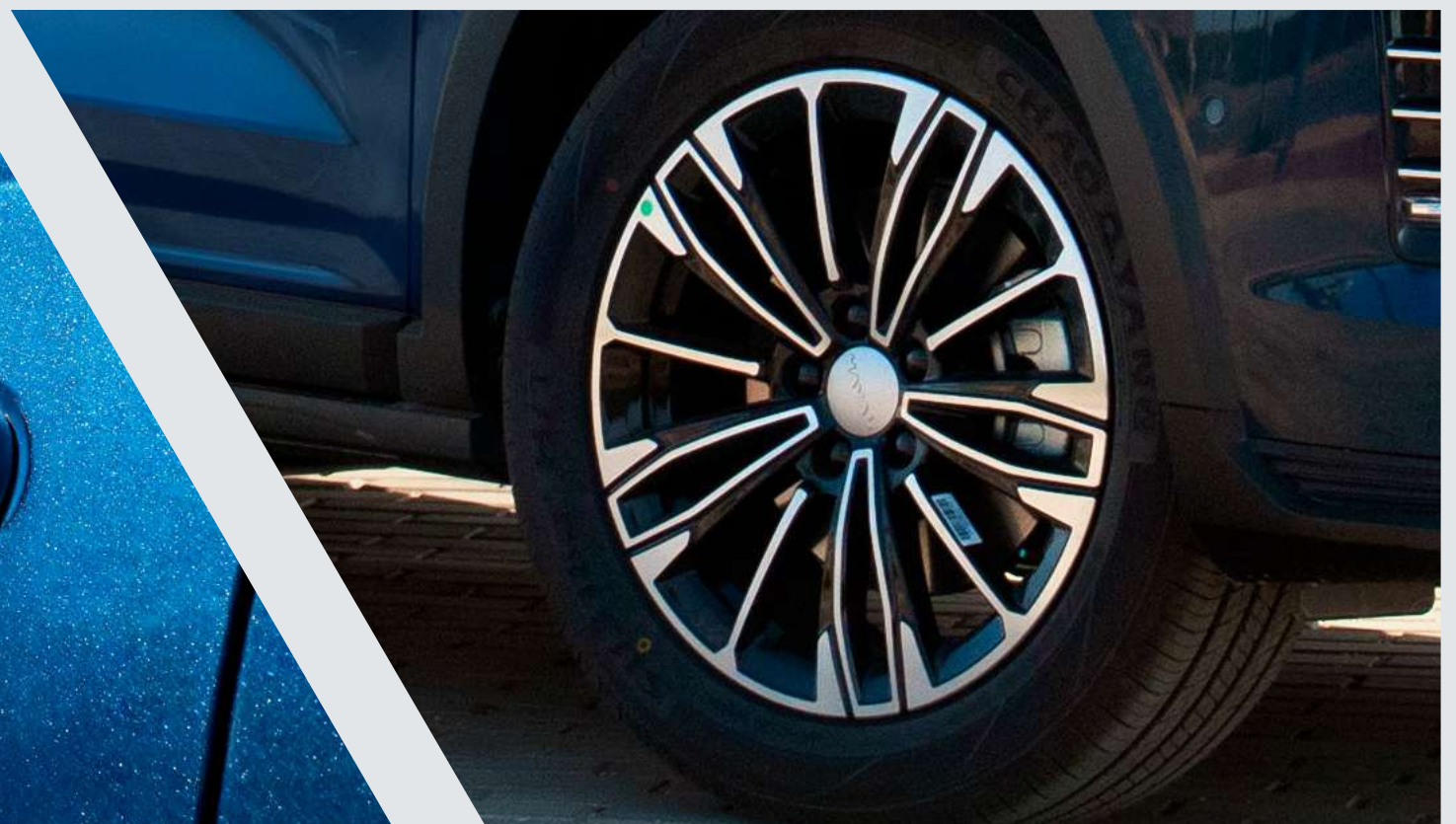
18" Alloy Wheels