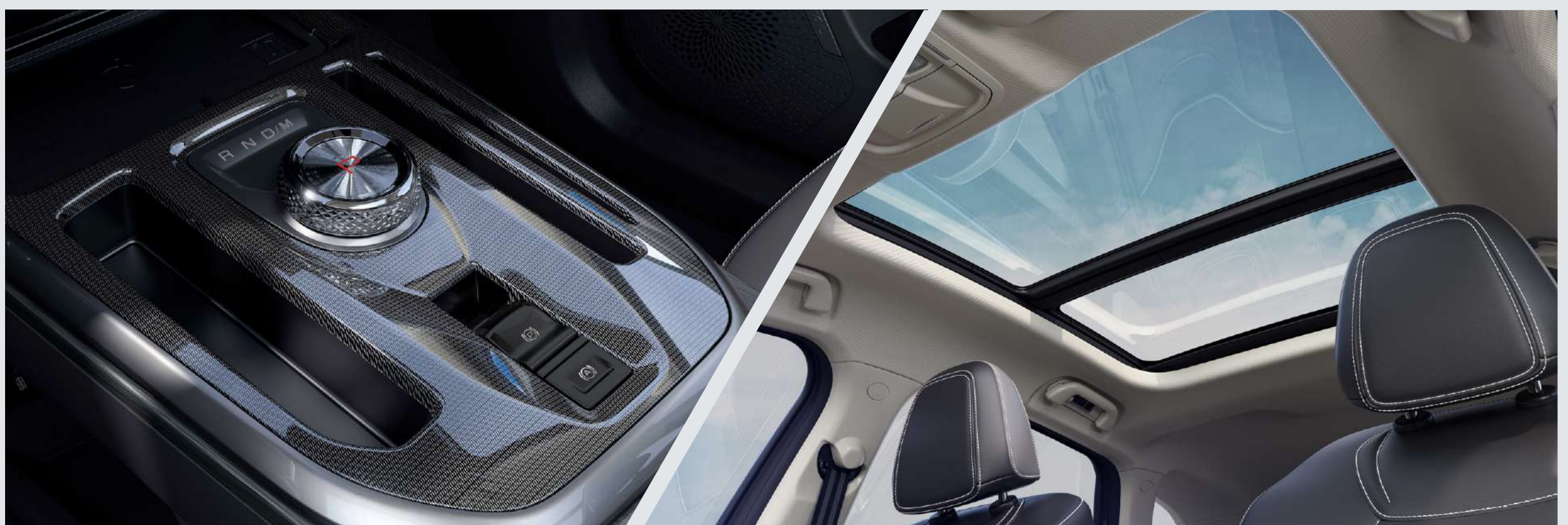
Rotary Gear Shift Dial 7 DCT - wet