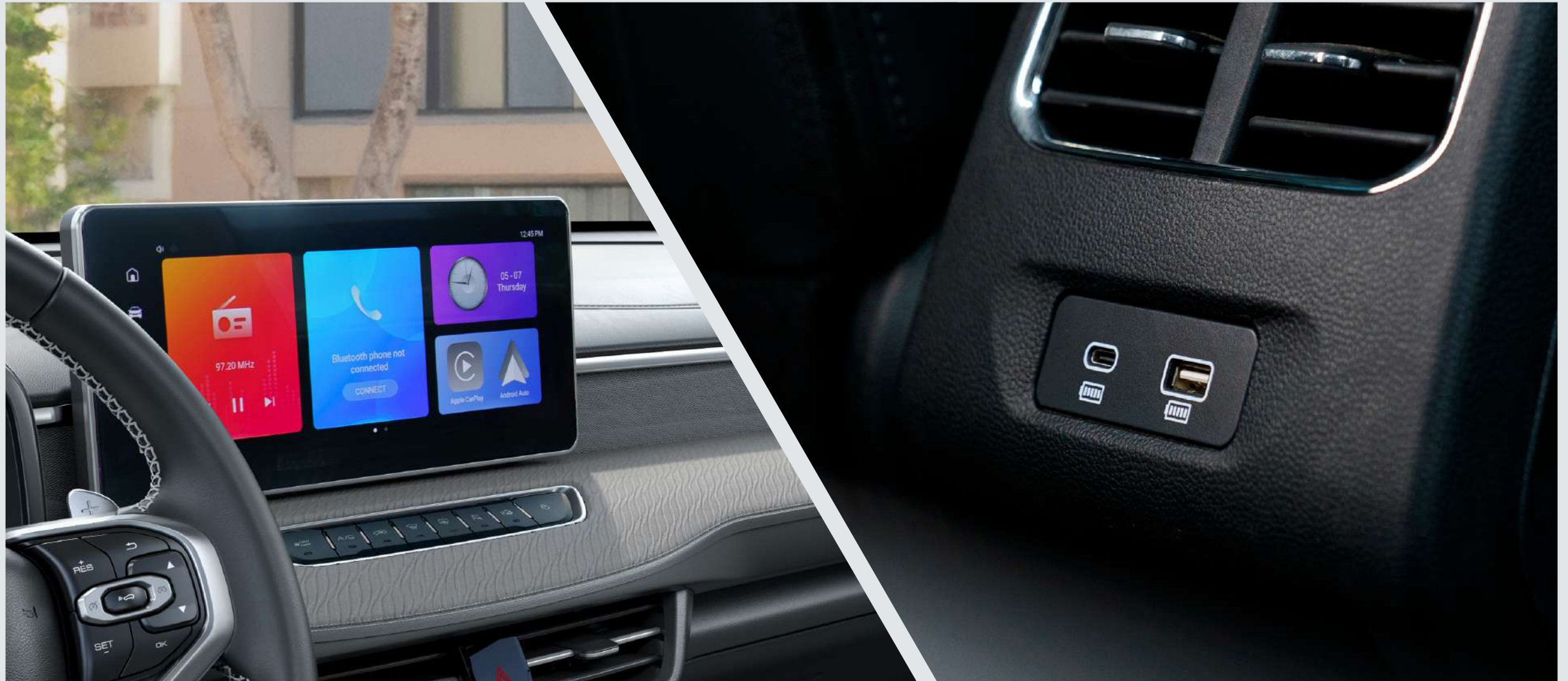
14.6" infotainment screen with wireless Apple CarPlay & Android Auto Connectivity.